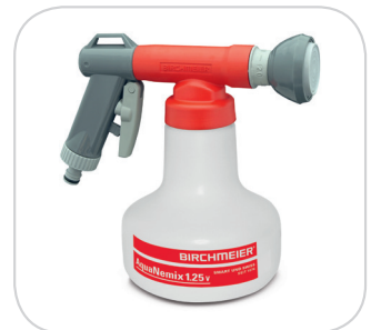
Spezialversion für Nematoden- ausbringung erhältlich (AquaNemix).